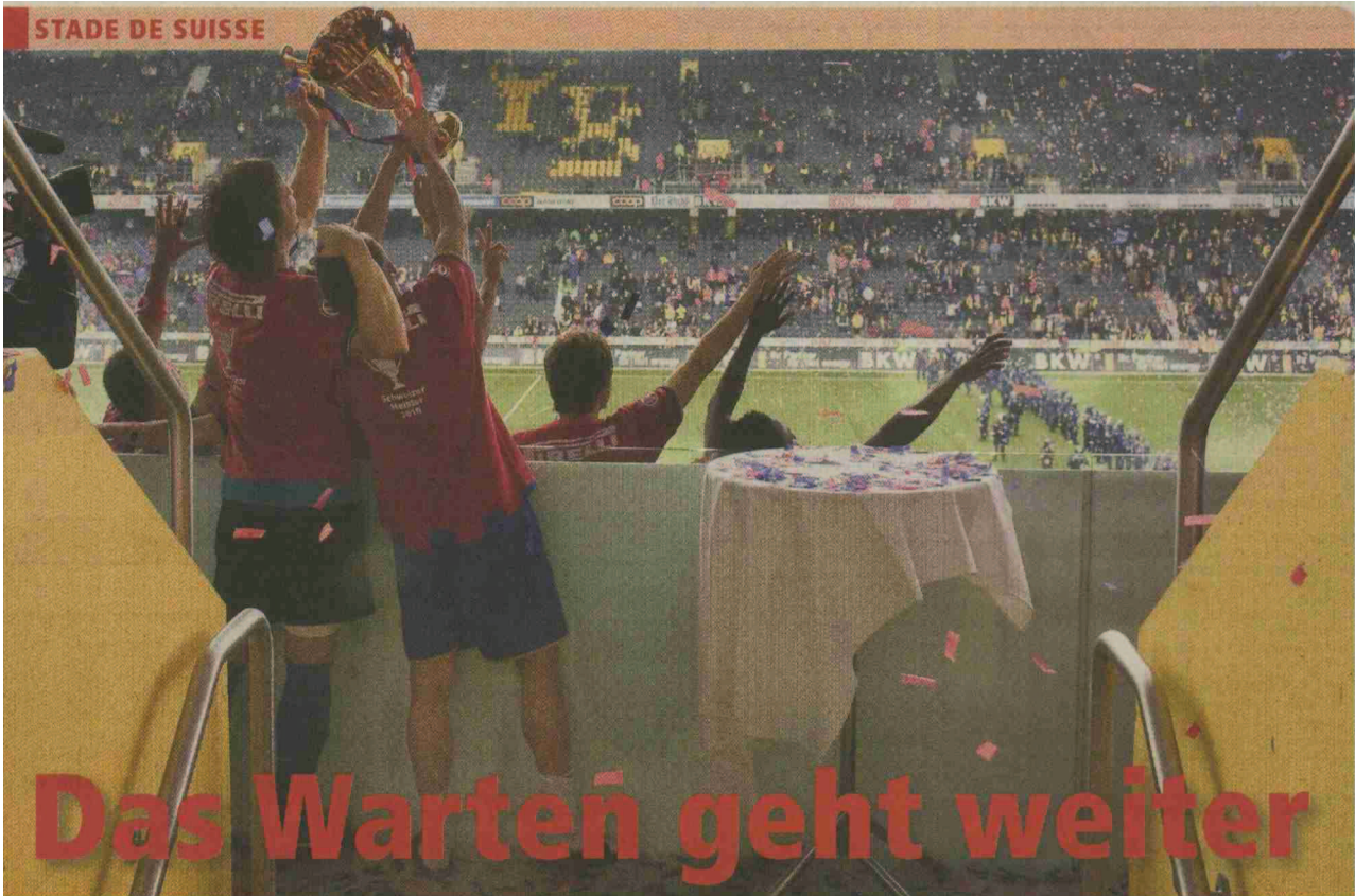
Der Zweitplatzierte sieht den Sieger stets von hinten....: FCB-Spieler präsentieren den Meisterkubel im fast schon leeren Wankdorf-Stadion

Themen-Nr.: 650.4 Abo-Nr.: 1077154 Seite: 17 Fläche: 101'969 mm 2