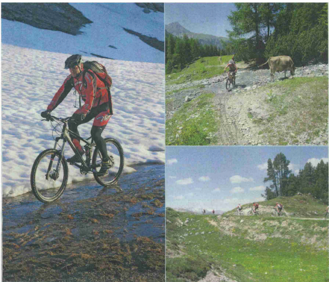
Impressionen von «Thömus TransAlp».

Themen-Nr.: 650.4 Abo-Nr.: 1077154 Seite: 109 Fläche: 50'051 mm 2